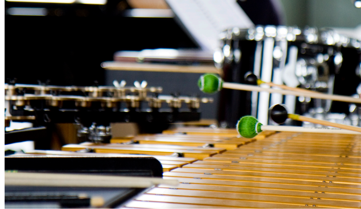
Saariaho festival The Hague 2011

Graal théâtre is one of Kaija Saariaho's most well known works. Jacques Roubaud's correspondingly titled book inspired the work. Roubaud's retelling of the old story of the quest for the holy grail inspired Kaija Saariaho in her own quest to rehash the old form of the violin concerto. The composer wrote of "a tension between composition of the music and the theatrical elements of a performance in which