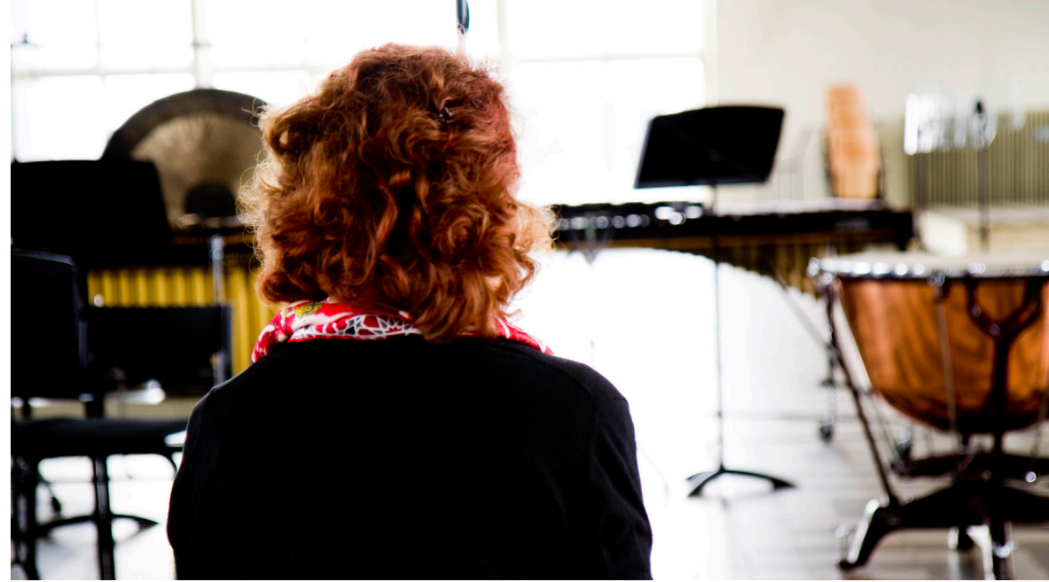
Saariaho festival | The Hague 2011

The relationship between humanity and nature is naturally bound by a time and a place as