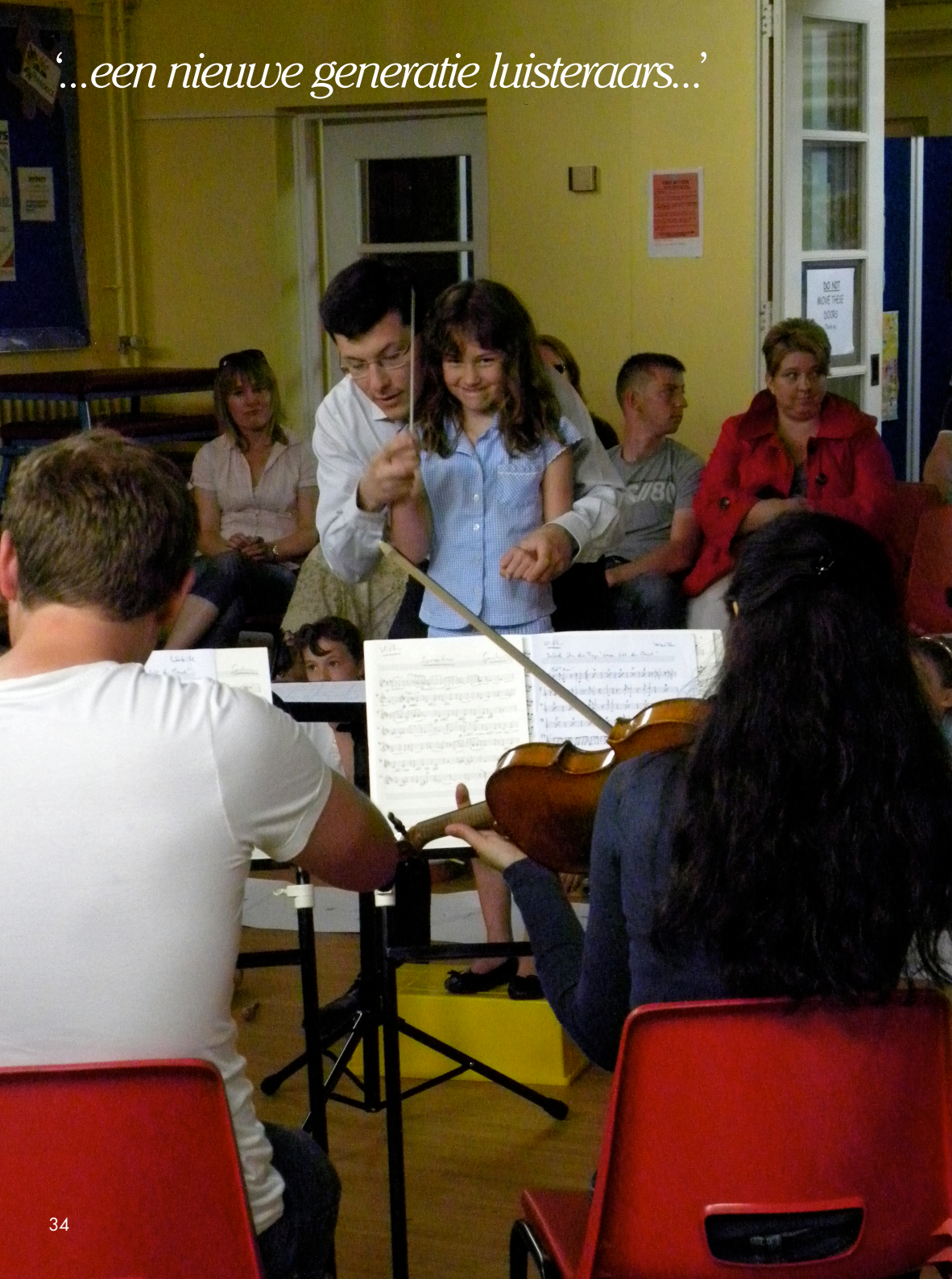
Saariaho festival The Hague 2011

‘...een nieuwe generatie luisteraars...’